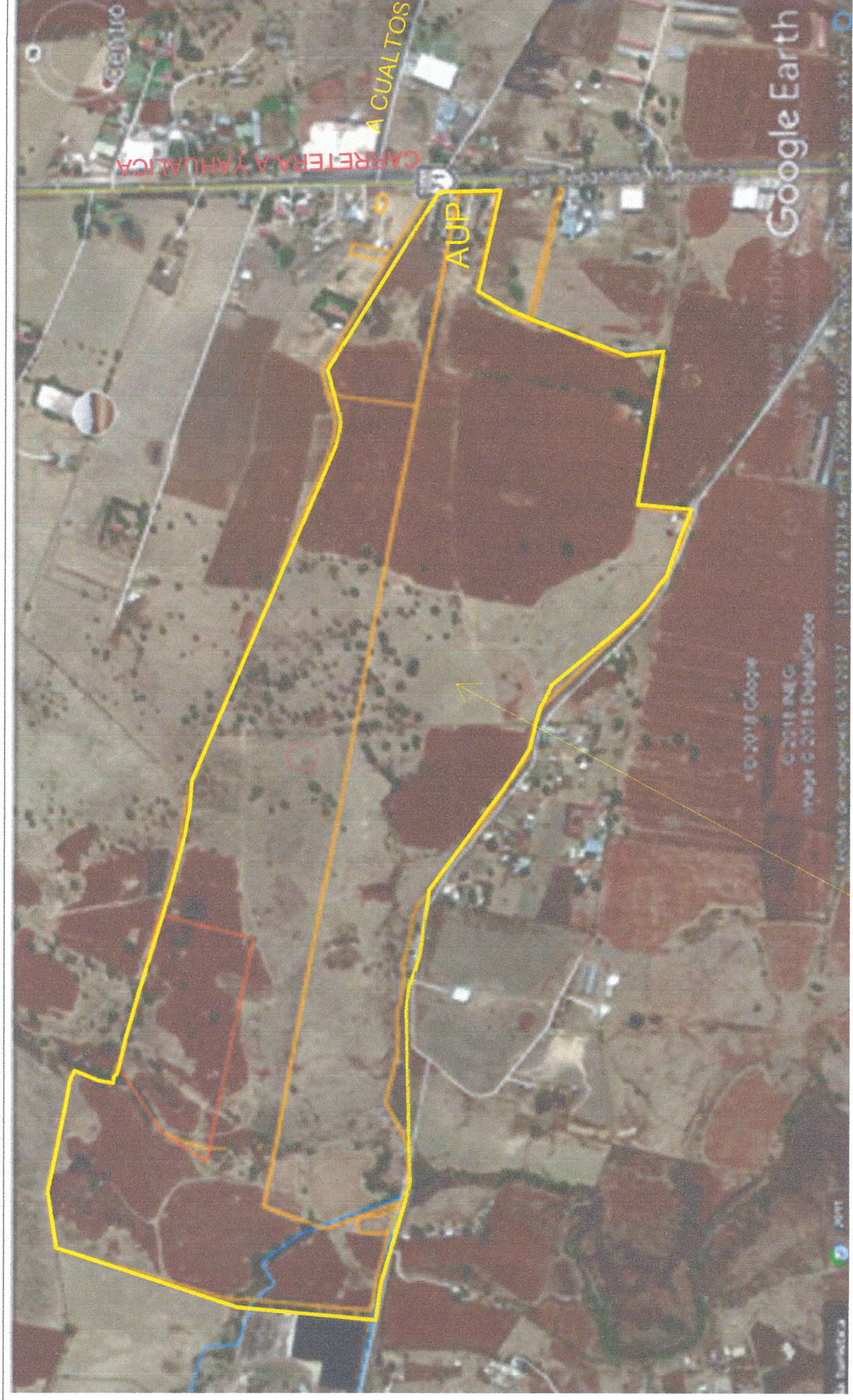
SOLICITUD: PREDIO A INTEGRAR COMO RESERVA URBANA